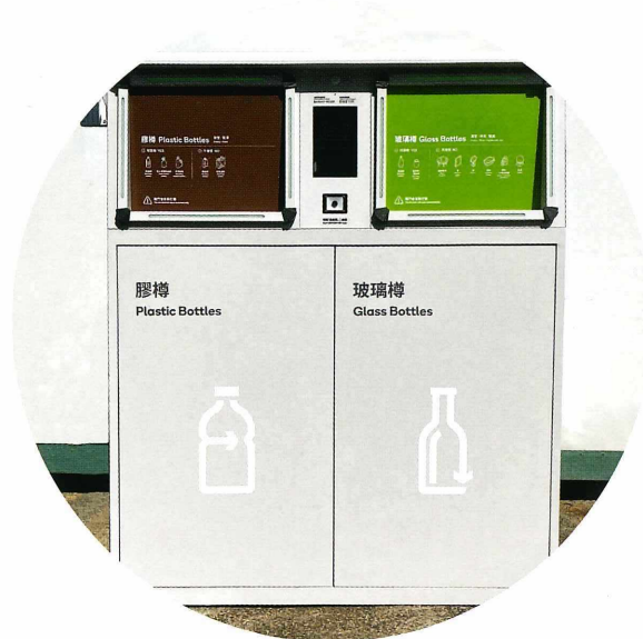
碧瑤自家研發智能回收機

署為期兩年的服務合約，為政府提供智能回收機及大數據分析平台，以發展智慧城市。智能回收機內置感應器，可實時探測及通知回收機構進行回收，以提升回收效率、減少過早收集浪費物流成本和碳排放，以及過遲收集造成的環境滋擾。