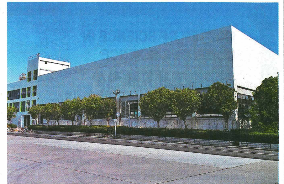
◎位於環保園，香港首間達準食品級別的塑膠回收設施，每日最高可處理100噸PET(1號)及HDPE(2號)塑膠樽。