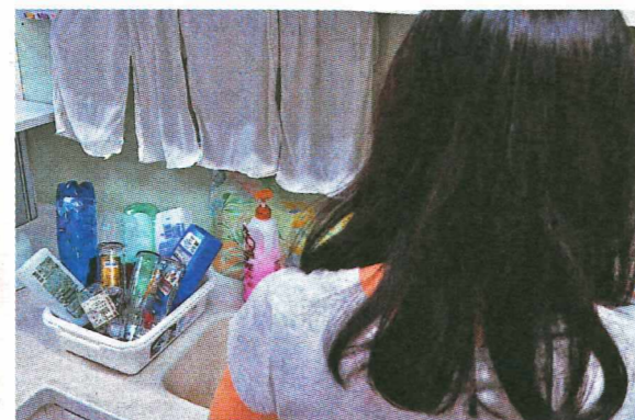
◎市民只需在家儲齊10個清潔的塑膠樽(1號或2號膠)或玻璃樽，便可安排「到戶回收」。

以往回收的方法主要是靠市民大眾自行將可回收物送投至回收桶，為了配合社會新常態的出現，回收工作當然亦要改變配合。碧瑤綠色集團的「iRecycle·愛回收」近日與皇冠爐具及酒和棧合作，推出「到戶回收」服務，回收飲料塑膠樽(1號膠)、清潔及個人護理產品塑膠樽(2號膠)及玻璃樽，讓大家可以減少外出的同時，亦可為保護環境出一分力，成功進行回收更可以透過「iRecycle·愛回收」流動應用程式將累積的環保回收紀錄化為積分，換領獎賞。市民大眾儲齊10個清潔的塑膠樽(1號或2號膠)或玻璃樽，然後致電或發短訊至預約服務熱線，便可以安排專人上門回收。回收後的玻璃樽會送交至碧瑤位於屯門的廢玻璃