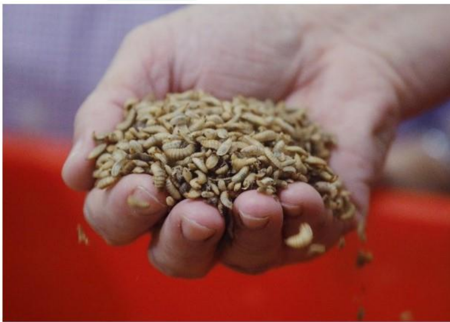
黑水虻幼蟲愛食有機廢物。